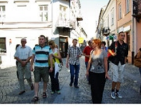
Na Trakcie Wielu Kultur w Piotrkowie Trybunalskim