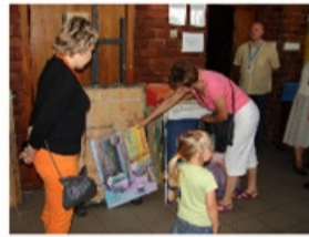
Wizyta w jednej z pracowni ASP w Łodzi

Obydwie wycieczki zakończyły się późnym popołudniem, ale żaden z uczestników nie odczuwał zmęczenia gdyż program przygotowany przez gospodarzy był ciekawy i bogaty w różne dodatkowe atrakcje.