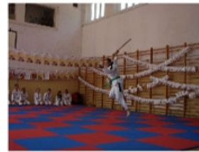
Pokaz Taekwondo w Gminie Skierniewice