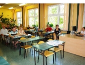
W Pabianicach spotkanie odbyło się w szkole ...