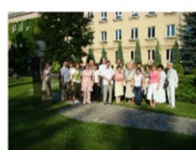
Zdjęcie grupowe w Instytucie Sadownictwa i Kwaciarstwa