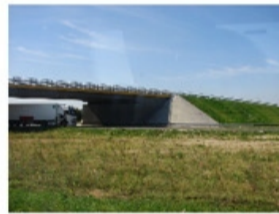
Droga wojewódzka 708