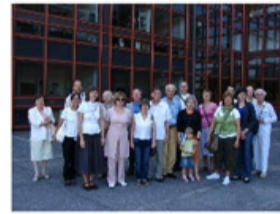
Zdjęcie grupowe przy ASP w Łodzi