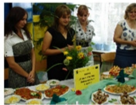
Poczęstunek przygotowany w jednej ze szkół w Gminie Skierniewice cieszył się dużym powodzeniem wśród uczestników wycieczki