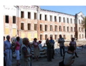
Miasto Skierniewice przygotowało wspaniałą prezentację projektu kluczowego RPO