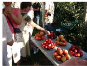
Instytut Sadownictwa i Kwaciarstwa im. Szczepana Pieniążka posiada rozległy sad w Dąbrowicach z którego uczestnicy wycieczki mieli okazję skosztować smacznych owoców